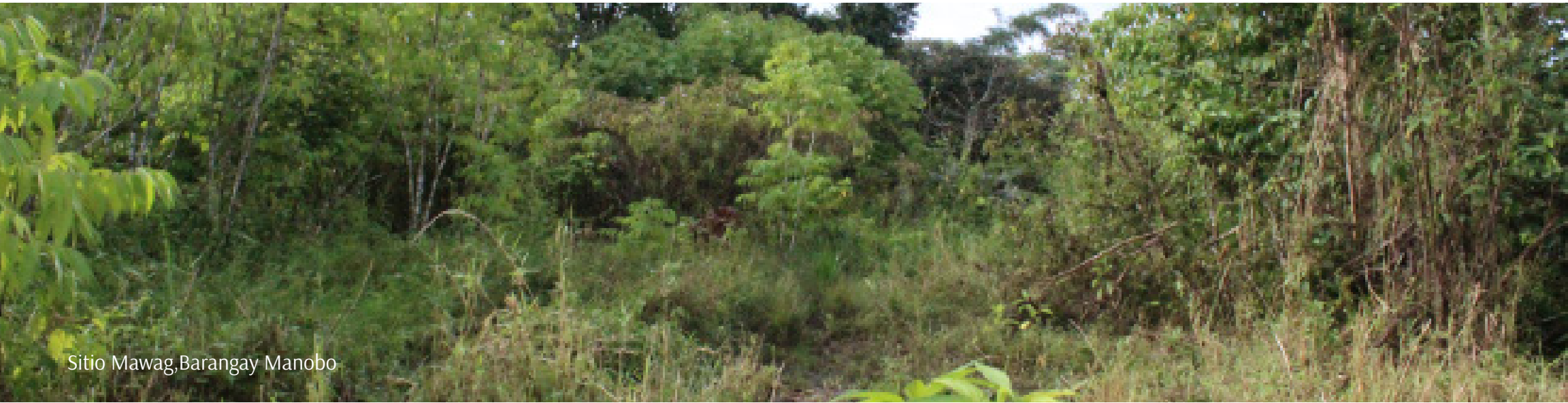
Sitio Mawag, Barangay Manobo

The first ever sitio in Manobo, Sitio Mawag, used to be progressive because of the agriculture industry. However, due to illegal logging activities and insurgency issues, people left and evacuated to different areas and converted Mawag into a burial ground.