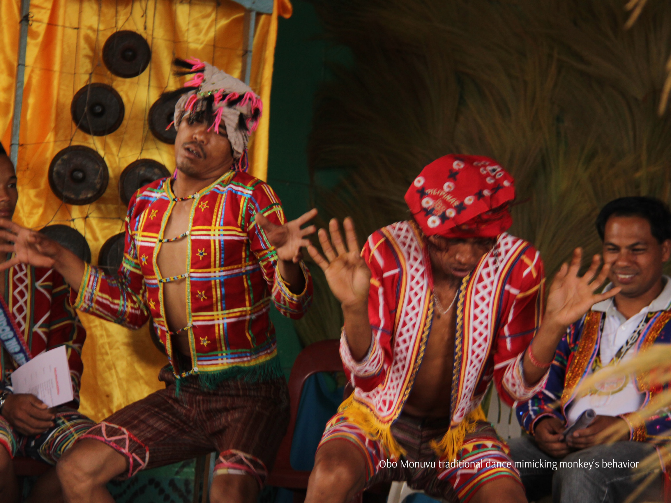
Obo Monuvu traditional dance mimicking monkey's behavior