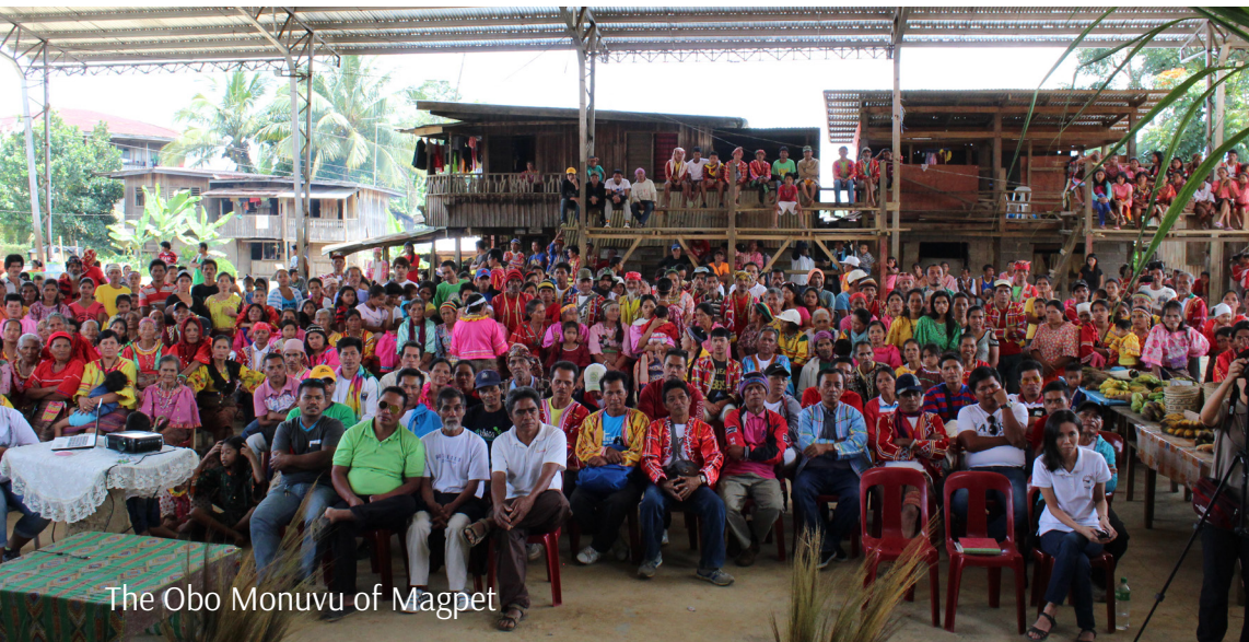
The Obo Monuvu of Magpet

The Obo Monuvu is an indigenous cultural community that resides at the foothills of Mt. Apo. Just like the other indigenous community within the Mt. Apo territory, the Obo Monuvu regard the Apo Sandawa as a sacred mountain as it was the praying mountain of their ancestors from a long time ago. It has been inculcated in their culture that this is an important part of their history as an Obo Monuvu.