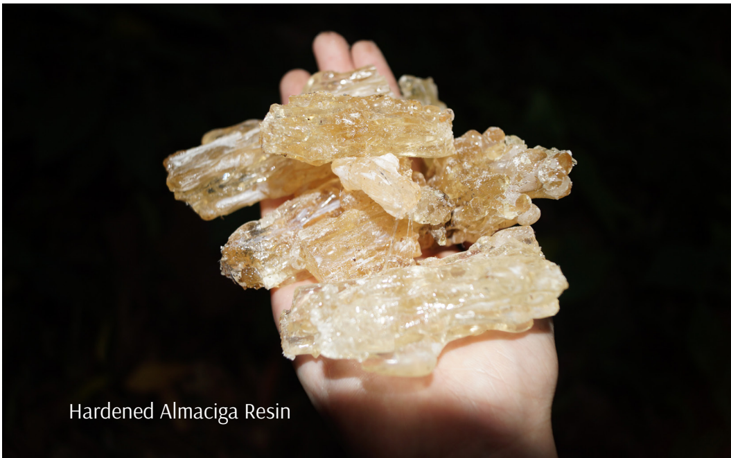
Hardened Almaciga Resin

Philippine deer, wild pig, palm civet, shrew, frogs, monkeys, bats, and snakes were hunted and cooked for food. In the past, hunts are shared within the community even in small amounts, as the elders believed that hunts from the forests should be shared by everyone. However, due to different influences that came to the Obo Monuvu, prey from the forests became a commercial industry, though at present, indigenous organizations have strict rules on hunting wild animals for sale, especially the endangered species.