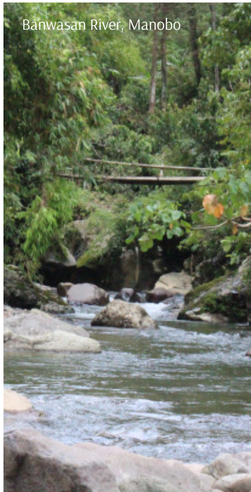
Banwasan River, Manobo

Diha sa yutang kabilin nga gidumalaan sa kini nga mga barangay anaa ang nagkalahi-lahing nga sagrado nga lugar nga adunay dakong bili sa kasaysayan sa tribo. Sa Manobo, adunay lugar nga ginatawag nga “Holy Place” nga mao ang lugar-ampoanan sa mga tao. Matud pa, ginadili ang pagsaba-saba ug pagpangguba ug mga butang sa lugar kay silutan ang mga musupak niini sa mga espiritu. Anaa say lugar nga ginatawag nga “Langit- langit” tungod kay taas kini nga lugar nga murag maabot na ang langit. Pareho sa Holy Place, ginadili ang pagsaba-saba ug pagpangguba sa lugar. Ang mga bukid ginatan-aw sad nga sagrado, sama sa Kol’lelan. Ang sapa sa Banwasan ginaingun nga liguanan sa mga katigulangan kaniadto tungod kay ang tubig nga gipanalanginan sa mga espiritu makaayo sa mga sakit. Ang mga pangpang duol sa sapa ginainun nga puluy-anan sa mga espiritu. Sa karun, ang tubig nga nagadagayday sa sapa mainom pa tungod kay ang gigikanan ani wala mahilabti.