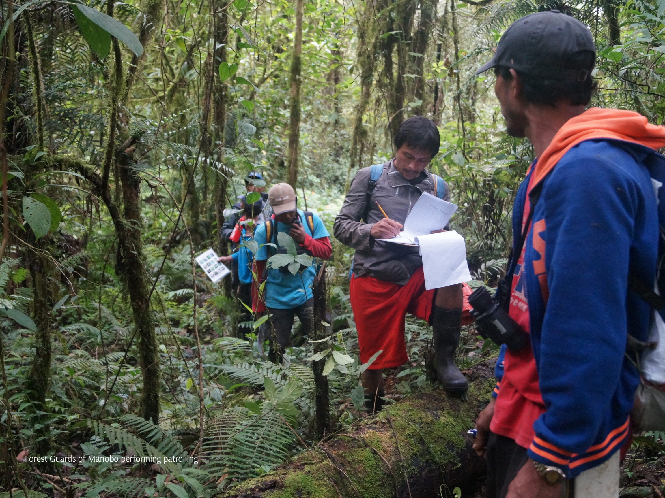
Forest Guards of Manobo performing patrolling