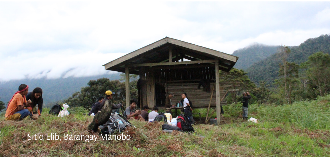
Sitio Elib, Barangay Manobo

In Sitio Elib lies the the source of water of Banlawon River, one of the biggest rivers that flows in Barangay Manobo. A natural water system is also located in the Sitio called the Sinupa that supplies most of the water needs in the barangay. Because of its vitality, harvest of hardwood and rattan is strictly prohibited in the area under the indigenous policies.