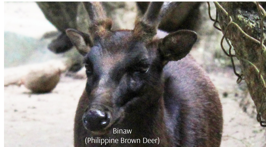
Binaw (Philippine Brown Deer)

Alang sa tribu, ang kalasangan dili lang lugar para sa pagkaon ug gamit alang sa adlaw-adlaw nga panginahanglan, lugar sad kini alang sa mga tradisyunal nga tambal. Ang sungay sa binaw, pangil sa baboy ihalas, ug ang lana, apdo, ug bukog sa baksan pipila lamang sa mga tradisyunal nga tambal sa Obo Monuvu. Adunay uban na mga tanom nga ginagamit isip tambal, apan ang mananambal lang ag nakabalo kung unsa ang makatambal sa usa ka sakit.