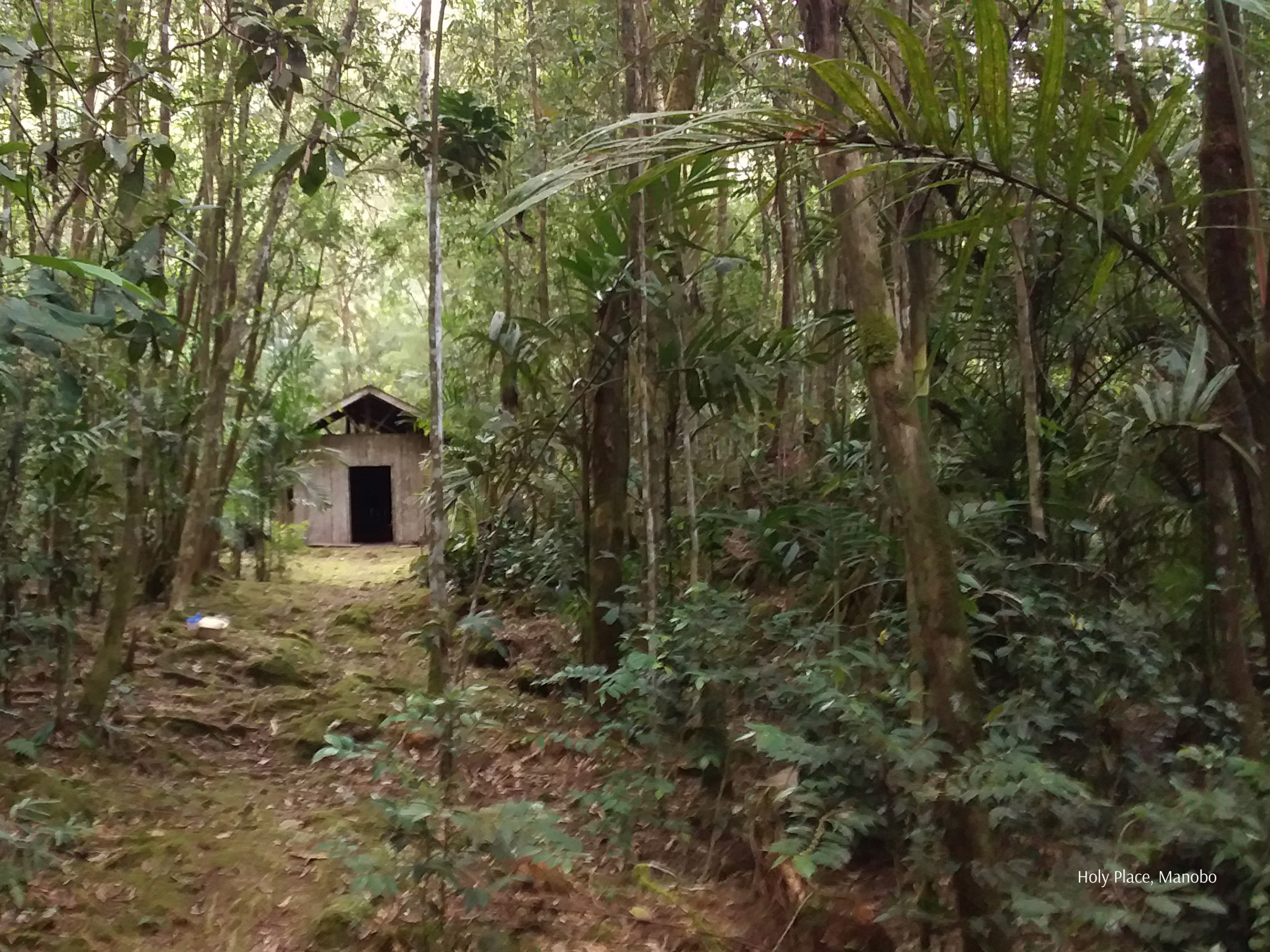
Holy Place, Manobo