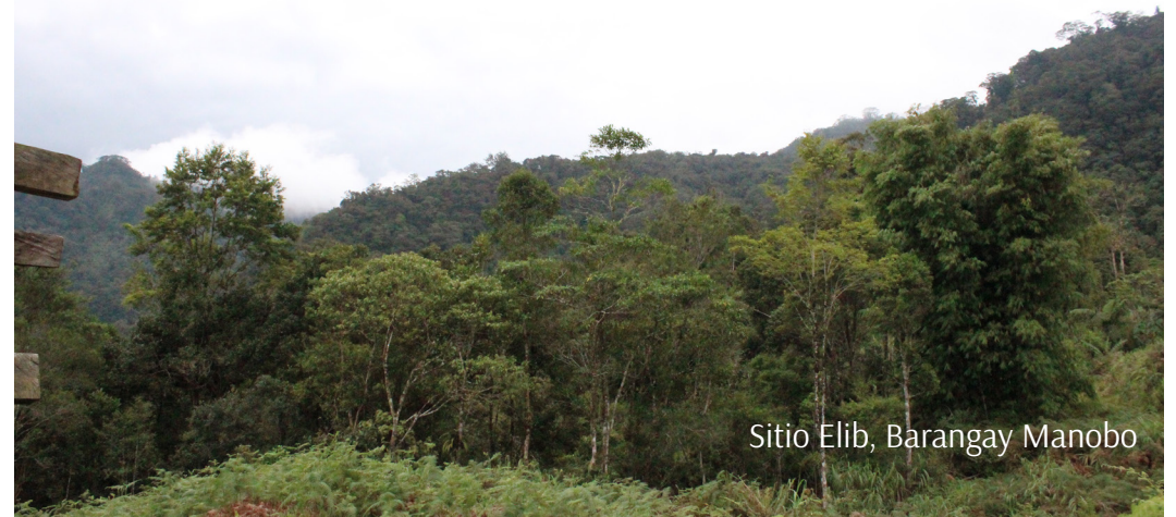
Sitio Elib, Barangay Manobo

Diha sa lisod nga agianan sa Manobo makita ang bungtod nga gihinganlan ug Pamantawan. Ginaingun nga sagrado kini nga lugar tungod sa iyang katas-on kung asa makita ang maanindot nga talan-awon. Aduna say traditional nga timailhan nga ginatawag nga Sa-sang, usa ka dako nga bato nga sama sa imahe sa balay. Ginabisita kini sa mga tao arun mag-alay ug trisbi, sinsilyo, ug pagkaon isip respeto sa mga nagpuyo sa lugar.