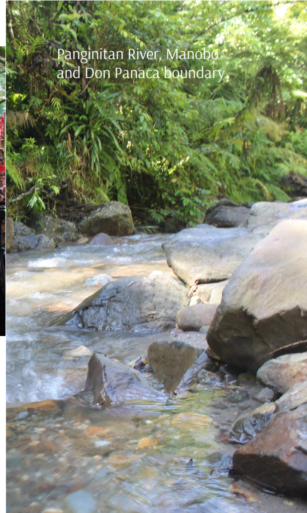
Panginitan River, Manobo and Don Panaca boundary