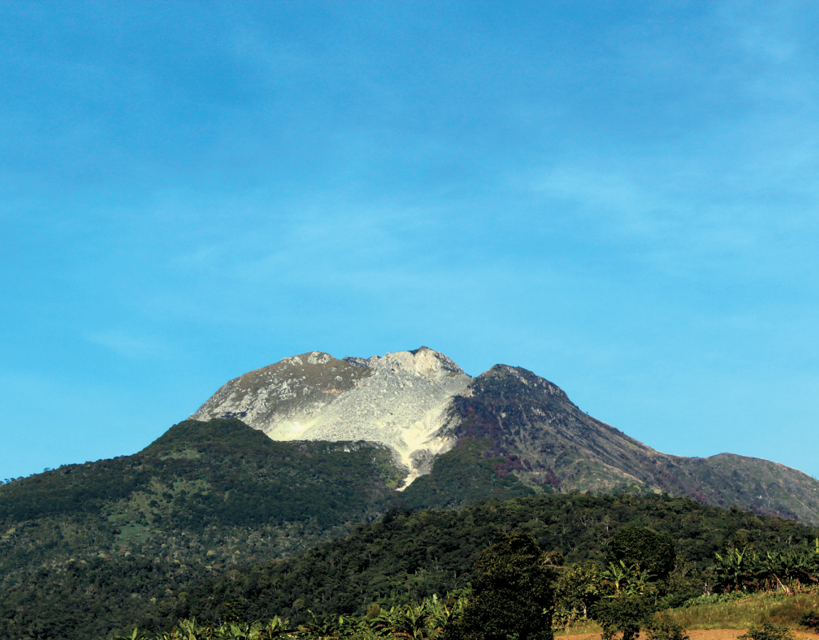
Apo Sondawa (The Apo Peak) is an Obu Manuvu sacred ground

We strongly believe that once something is sanctified as Pusaka , no one should harm or violate it. A Pusaka must be treated with value and respect. If a certain place is Pusaka no one can hunt in that area unless a traditional ritual is performed. These areas are abodes of spirits who guard the place. In respect, we appease them and provide offerings through our rituals. The rituals are our way of communicating to spirit owners of Pusaka ; whether we can proceed with our journey or not. They respond through omens.