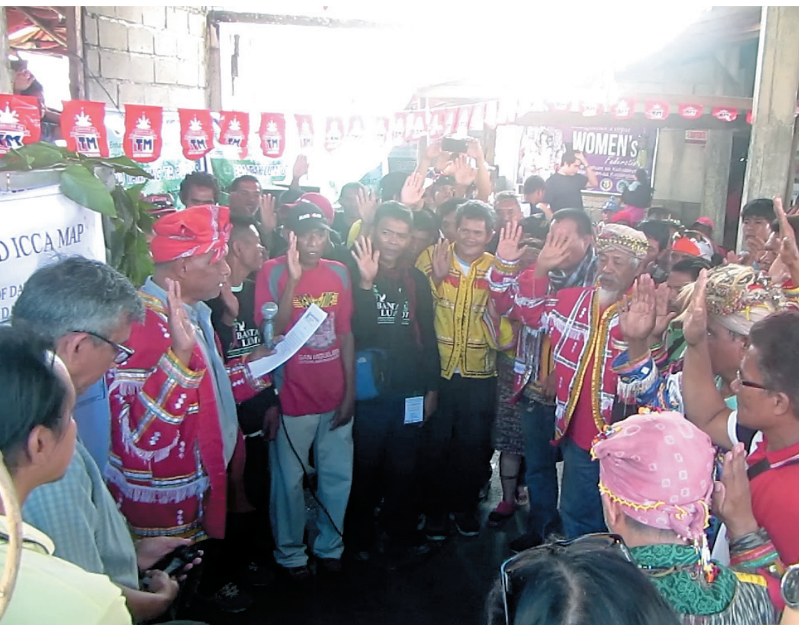
Oath-taking of the Pusaka Council held on December 10, 2016 during the Allow to Obu Manuvu Celebration

As an offshoot of the Pusaka initiative, we have also crafted village-based Community Development Plans (CDP) in four pilot Obu Manuvu barangays (Carmen, Tawan-tawan, Tambobong and Salaysay). The CDP contains village aspirations for sustainable rural development both for the ancestral domain and its indigenous inhabitants. The site-based CDP details and operationalizes the more centralized Ancestral Domain Sustainable Development and Protection Plan (ADSDPP).