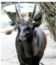
Philippine Brown Deer