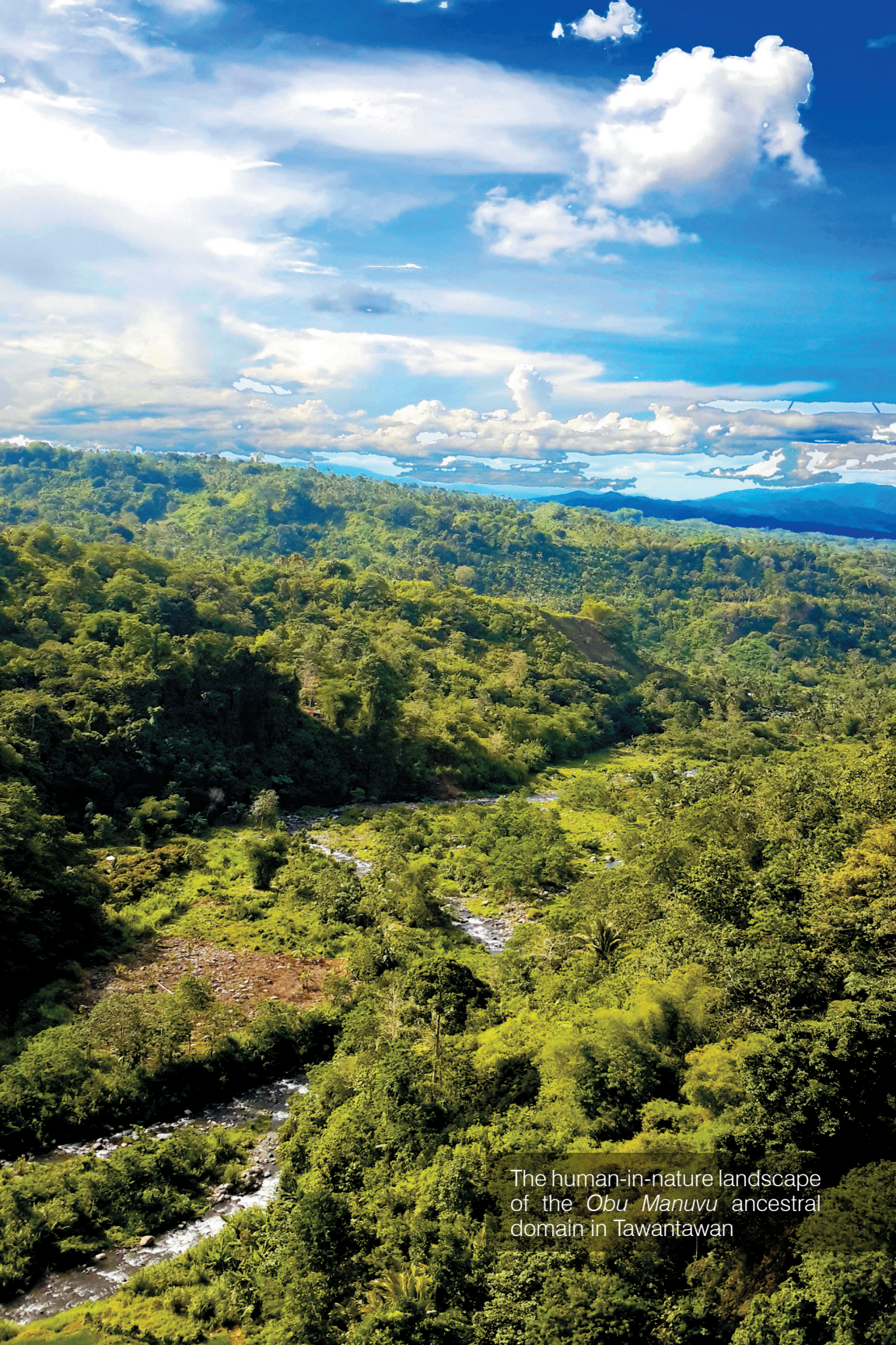
The human-in-nature landscape of the Obu Manuvu ancestral domain in Tawantawan