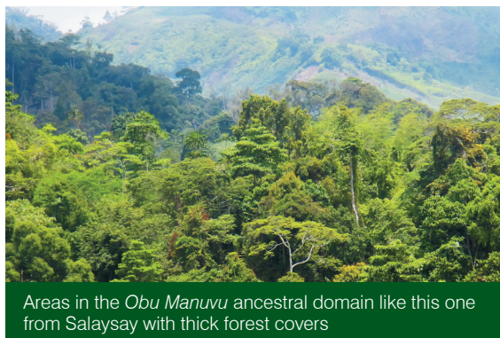
Areas in the Obu Manuvu ancestral domain like this one from Salaysay with thick forest covers

Nakabuhat nami ug mga baload nga buhaton sa tanan para sa konserbasyon sa kinaiyahan, pareho sa dili pagpamutol sa dagko nga kahoy ug ang pagdeklara sa usa ka lugar isip lugar sa pagpangayam. Naa puy mga lugar nga dili pwede pangasohan o sudlan.