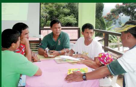
Community Development Plan Formulation of Barangay Salaysay, Tawantawan and Tambobong