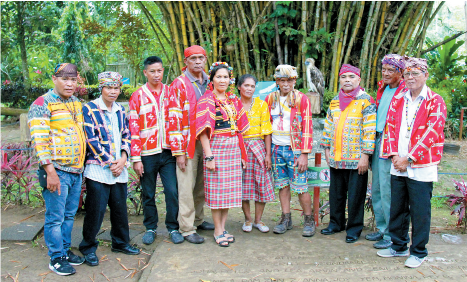
The Unified Obu Manuvu Tribal Council with Philippine Eagle "Fighter" at the Philippine Eagle Center

We, the Obu Manuvu , are one of the subtribes of Bagobo who originated from Bagobo Klata and Bagobo Tagabawa intermarriages. We are found in three provinces of Mindanao: Southern Bukidnon, Northeastern Cotabato and Northeastern Davao.