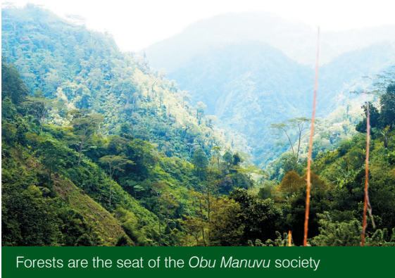
Forests are the seat of the Obu Manuvu society

Cutting of trees is not allowed near bodies of water and in protected areas. Offenders must perform a pomaas wherein one must surrender 50 kilos of meat, rice, and Php1,500. Datus (leaders) who failed to report any illegal logging activity is also made accountable. If one must cut a tree, the cutter is required to plant 100 trees in the suitable area.