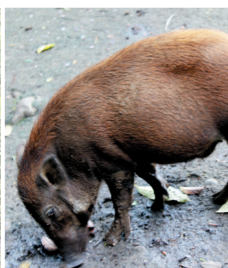
Philippine Warty Pig

Recently, we identified several criteria that can qualify an entity as Pusaka of the Obu Manuvu —historical value, relevance to our faith, cultural significance, economic benefits, and value to the ancestral domain. We consider (i) water systems, (ii) mountains, (iii) hunting grounds, (iv) rivers, (v) forests, (vi) cliffs, (vii) caves, (viii) burial grounds, (ix) hiding places, (x) landmarks, (xi) slopes, and (xii) holy places as Pusaka . Most of these landscapes are mentioned in our folklores and epics; places where our ancestors went, occupied, and bathed (rivers & streams). In some of our epics, these places are battlegrounds where our heroes fought the evil forces who tried to invade our lands.