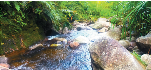
Edible frogs are traditionally collected in this pristine stream in Tawantawan

Ginakonsidera pud namo ang mga hayop isip Pusaka sama sa (i) banog, (ii) sarong, (iii) bavoy't movonos, (iv) lakivot, (v) uvah, (vi) kolyawa, (vii) singgawng, (viii) limukon, (ix) simallon, (x) kayamatton, ug (xi) togkos. Kaning mga hayop na ni nay kultranhong ug makasaysayan nga bili sa among tribo nga mabasa kini sa mga epiko. Ang usa ka epiko nagsulti kung paunsa napatay ug gibuhi ni Apo Tuwaang ang usa ka dako nga langgam nga maoy niingun na alagaran ug protektahan niya si Apo Tuwaang. Kini nga langgam dako ang pagkapareho sa banog kun sa Philippine Eagle.