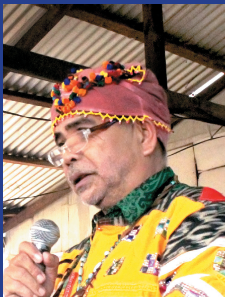
Ang Tangkalo usa pud ka Pusaka alang sa nanag-iyá niini.

Dugay na kini nga ginabuhát sa among kumunidad, apan wala kini nakadokomento. Maski dugay na namo ni nga ginabuhát sa una pa, wala gyud kamiy konkreto nga kahulugan sa Pusaka , nga usa sa mga rason nganong lisod unsaon pagdeklara sa us aka butang nga Pusaka . Ginapasa lang ang kahulugan sa Pusaka pinaagi sa pag-storya ug pagsaysay niini. Naay mga pamilya ug kaliwatan nga nay Pusaka nga gong, hayop, ug mga gamit sa pagpangaso nga maoy naay bili para sa ila ug ila kining ihatag sa mga sunod nga henerasyon. Apan tungod sa pagbag-o sa panahon, ang kini nga binuhatan anam-anam nang nakalimtan sa batan-on nga henerasyon. Tungod niini, gusto namo nga magbuhát ug sinulat ug taman nga dokumentasyon sa Pusaka arun among mabasa ug mahatag namo sa sumusunod nga henerasyon