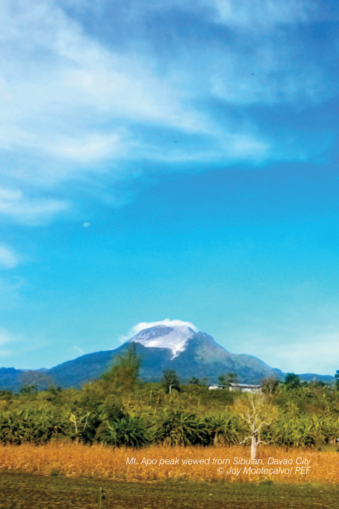
Mt. Apo peak viewed from Sibulan, Davao City