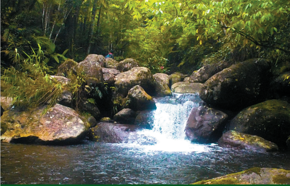
This stream from Tawantawan is regarded as spirit abode

Kani anhi lang, nagbutang kami ug mga kwalipikasyon nga madeklara ang usa ka butang nga Pusaka sa Obu Manuvu—bili sa kasaysayan, pagtuo, kultura, pang-ekonomiyang benepisyo, ug ang yutang kabilin. Ginakonsidera namo ang mga sistema sa (i) tubig, (ii) mga bungtod, (iii) lugar sa pagpangayam, (iv) sapa, (v) kalasangan, (vi) pangpang, (vii) kweba, (viii) lubnganan, (ix) taguanan, (x) landmarks kun mga timailhan, (xi) bakilid, (xii) ug mga sagrado nga lugar isip nga Pusaka. Kaning mga lugar madungog sa mga istorya sa mga katigulangan ug sa mabasa sa among mga epiko kung asa nagaanhi ang among mga apohan, nagpuyo, ug naligo. Sa uban nga mga lugar diri nakigbisog ang among mga apohan sa mga demonyo nga gusto kuhaon ang among kayutaan.